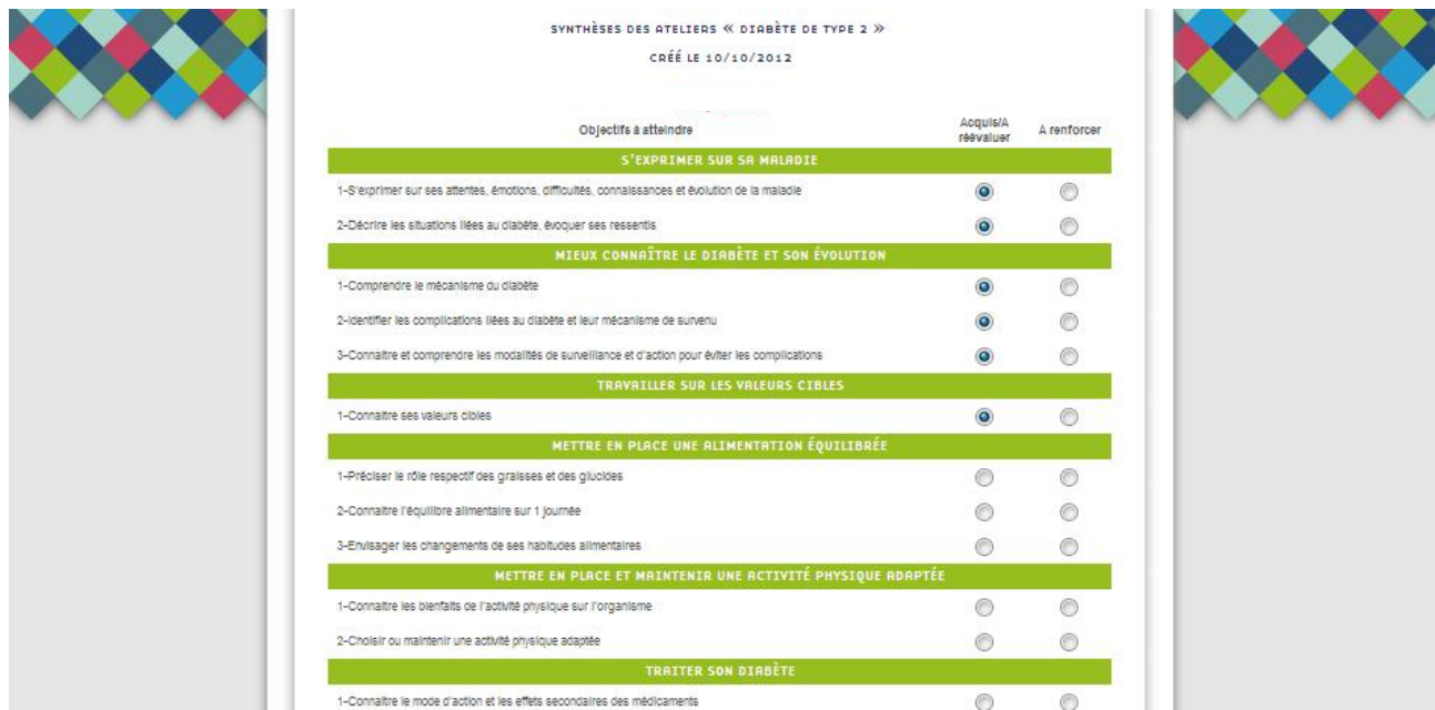
Exemple de page accessible aux patients : La synthèse d'un atelier

Le patient peut à tout moment accéder en ligne à son dossier éducatif. Il peut consulter les prochaines dates de ses ateliers, l'évolution de son parcours éducatif, ainsi que différents documents pédagogiques et informatifs. Il peut aussi échanger avec les professionnels.